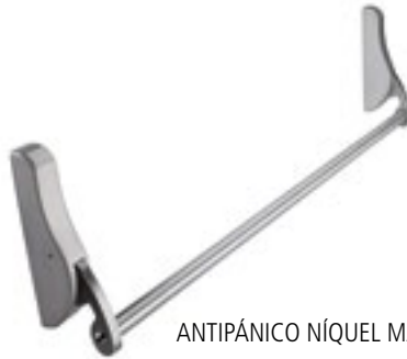
ANTIPÁNICO NÍQUEL MATE