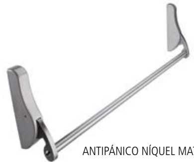
ANTIPÁNICO NÍQUEL MATE