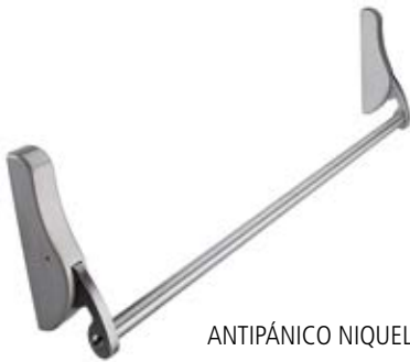
ANTIPÁNICO NIQUEL MATE