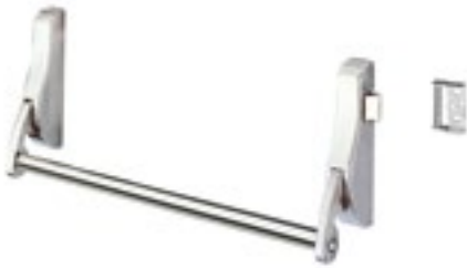
ANTI-PANIQUE ACIER INOXYDABLE