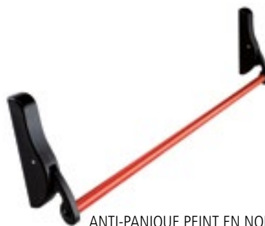
ANTI-PANIQUE PEINT EN NOIR