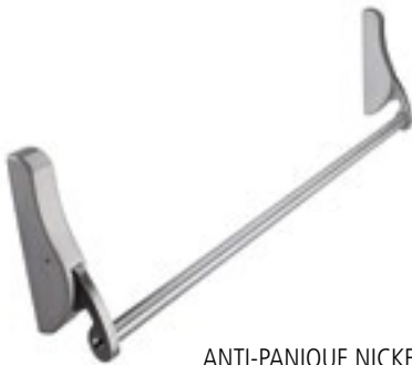
ANTI-PANIQUE NICKEL MAT