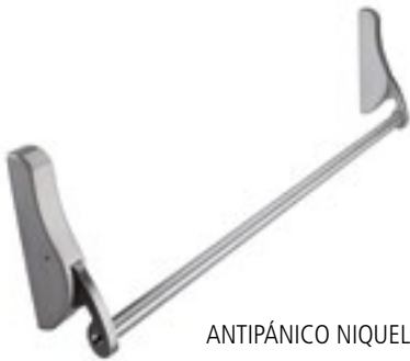
ANTIPÁNICO NIQUEL MATE